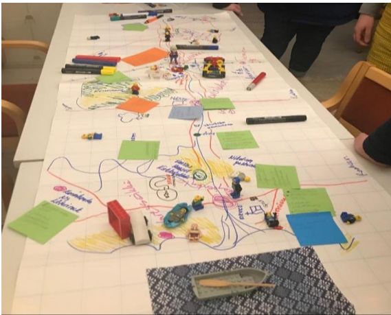
Kuva 2 Työpajassa havainnointiin Kylien helminauha -idea.